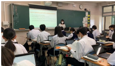
授業の様子（生徒はChromebookで作業中）