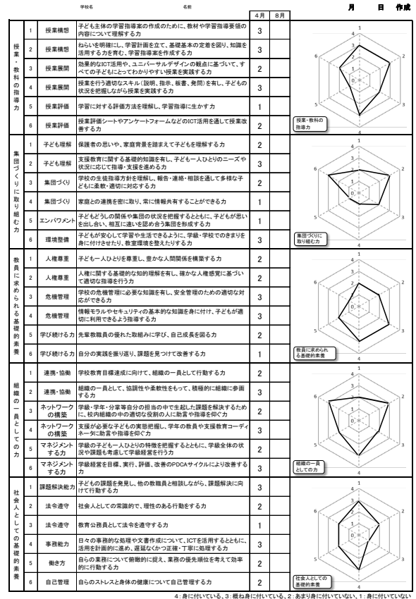
自己成長・確認シート（例）