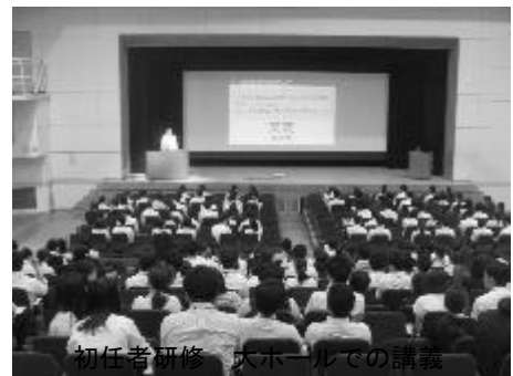
初任者研修 大ホールでの講義

※「指導教員」は、校長の指導の下に、年間指導計画に従い、初任者に対して指導及び助言を行います。中学校、高等学校及び支援学校においては、指導教員の免許教科が初任者の免許と異なる場合は、原則として、初任者の免許教科に応じ、「教科指導員」を置くことになっています。