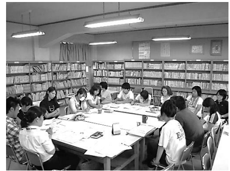
校内での授業力向上に係る研修

教職員には、勤務時間外にあっても、自発的に研修に参加し、あるいは自ら研修することが大切です。