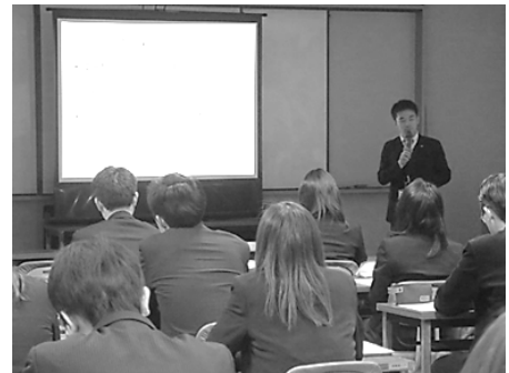
大阪府教育センターでの研修