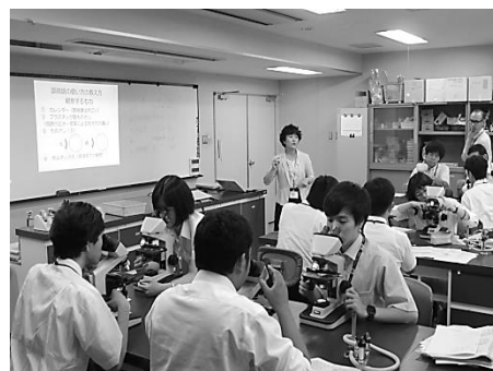
大阪府教育センターでの理科授業づくり研修