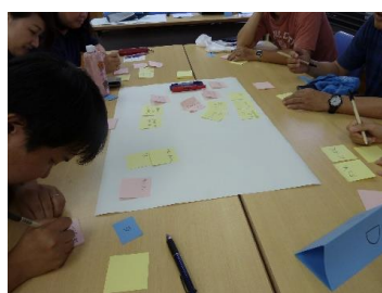
校内全体研修の様子

を目的として、「めざす生徒像」やそれに向けた方策をグループで考えた後、全教員で共有しました。このように、「どのような生徒を育てたいか」という目標を言語化して教職員間で共有することで、授業改善に学校全体で取り組む意識を育み、意見交換の場を作り、他教科の授業実践について知るきっかけとしたのです。