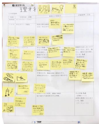
協議で使用するために拡大した指導案

11月の研究協議では、教科を越えて意見を交換できるように、各教科で意見をまとめた後、教科を越えて共有する時間を設けました。